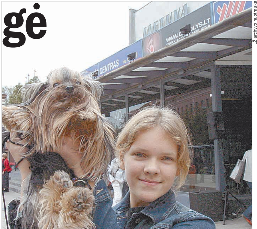
LŽ archyvo nuotrauka

5 p. Jau piketavo "Lietuvos" likimui neabejingi ir žmonės, ir šunys.